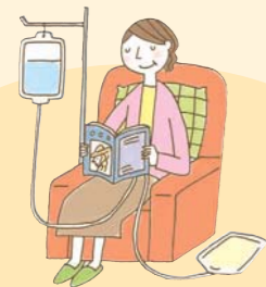
1日数回バッグを交換する CAPD