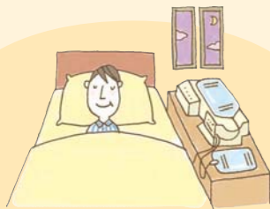
就寝中に治療を行う APD